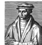
Collegium Beatus Rhenanus